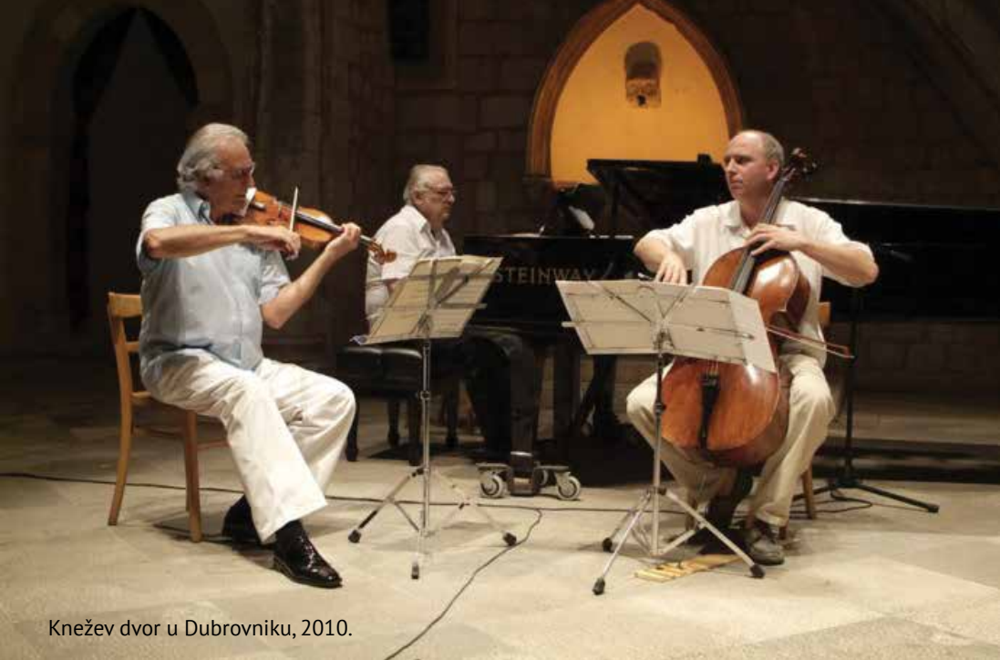
Knežev dvor u Dubrovniku, 2010.